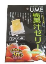
梅干し、梅ゼリーセット