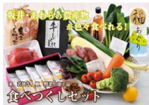
詰め合わせセット