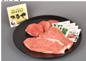
若狭牛ステーキセット