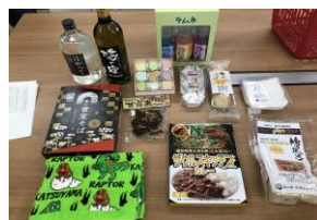
詰め合わせセット