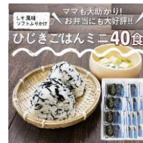
ひじきごはんミニ(40食)