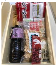
詰め合わせセット