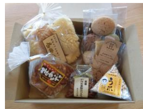
池田のこびりセット