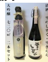
清酒 雪のしずく・雪きらら 大吟醸2本セット