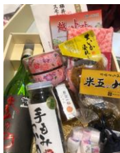
詰め合わせセット