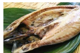
脂がのったト口鱈 3枚セット