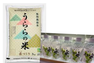
池田のお米セット