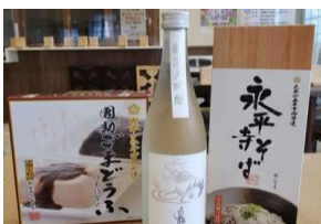
詰め合わせセット