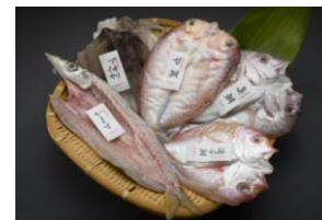
若狭高浜 季節の干物セット ※魚種は水揚げ状況によります