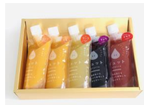
飲むゼリー詰合せ