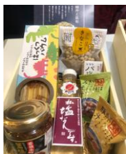
詰め合わせセット