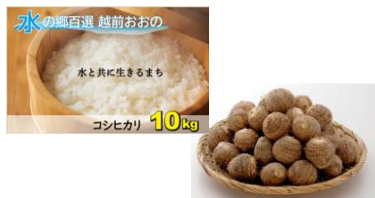
越前おおの産コシヒカリ10kgと 上庄里芋5kgのセット