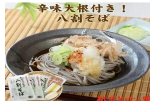
越前おろしそば (辛味大根・ 特製七味付) 八割そば6食