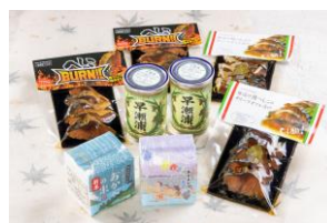
若狭美浜・ぜいたくセット