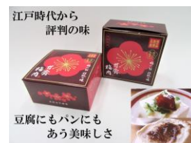
甘露 梅肉 160g×4個