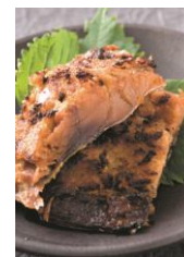
さばのへしこ ※写真はイメージです