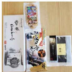
詰め合わせセット