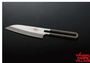
川崎和男デザイン 【クレウス13】小三徳130mm