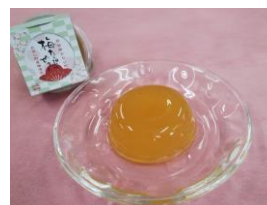
梅たっぷりゼリー 12個入り