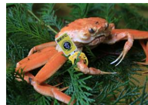
浜茹せいこがに ※写真はイメージです