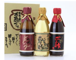
お酢ギフト 3本入り