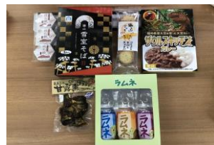
詰め合わせセット