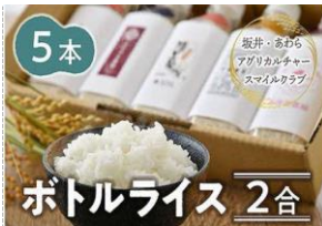
5本 ポトルライス 2合