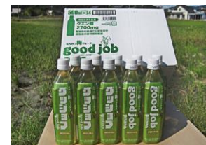
グッジョブ 12本 グッジョブα 12本 セット