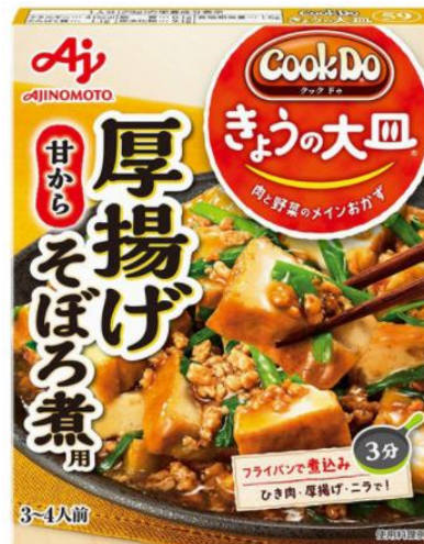
「CookDo®」きょうの大皿 厚揚げそぼろ煮