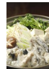
若狭ふぐてっちりセット (3~4人前)