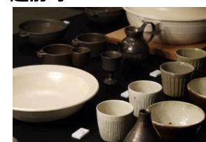
越前焼き ※写真はイメージです