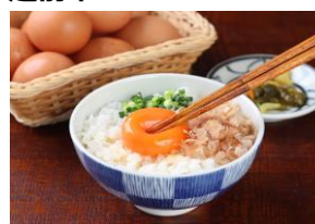
ミネラルを豊富に含んだ 越前赤玉子 50個 ※割れ補償の5個を含む