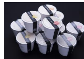
高浜たべごろアイスセット