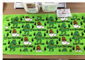
詰め合わせお風呂セット