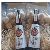
上庄里芋洗い子と ころ煮だしセット