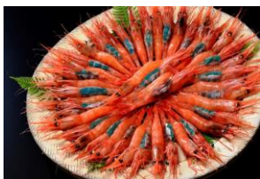
坂井市と言えば甘海老セット