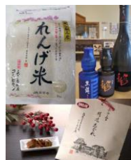
詰め合わせセット