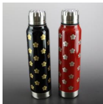
漆絵アンブレラボトル