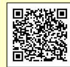
新規会員登録ページ

右記のコードをスマートフォンで読み取り Sports net ID (RUNNET) の新規登録画面に移動します。